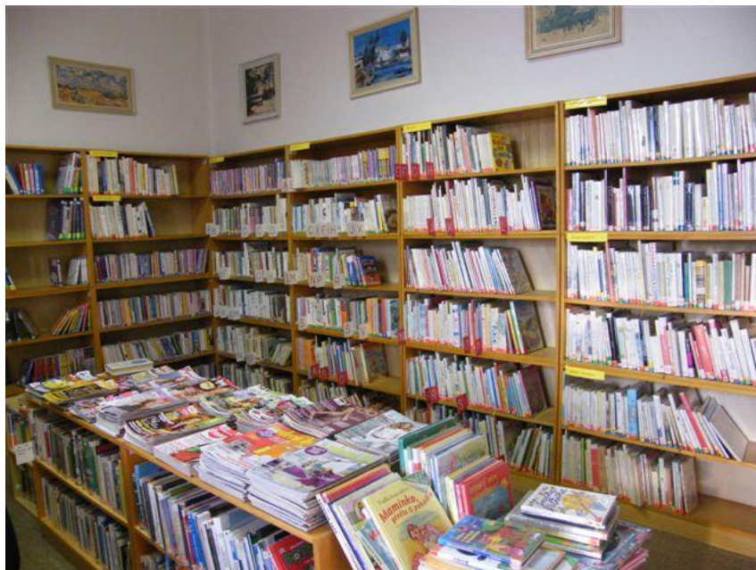
Obr. č. 1 – Interiér knihovny v Novém zámku

Prostory v Butovicích jsou mnohem větší (186,7 m 2 ). V přízemí je půjčovna a dva počítače s přístupem na internet pro veřejnost. V poschodí je studovna se čtyřmi počítači s internetem pro veřejnost. Všechny počítače mají přístup na internet zdarma. Studovna byla nově vybavena nábytkem. Knihovna také zakoupila dataprojektor a promítací plátno, notebook, malířské stojany a desky. Od února 2011, po zakoupení nového automatizovaného knihovního systému Clavius, je v provozu online katalog, což způsobilo nárůst čtenářů a propojení obou budov knihovny. Čtenáři si teď mohou objednávat knihy nezávisle na tom, kde jsou umístěny. Po uložení záznamů celého knihovního fondu do elektronické podoby byly klasické lístkové katalogy odstraněny. Celá tato akce trvala asi čtyři roky a celý knihovní fond byl znovu rekatologizován. Knihovna má nevyhovující sklad pro uložení knihovního fondu ve vázaném výběru. Potřebovala by mnohem větší skladové prostory. Bohužel není naděje, že by je získala. Finanční situace zřizovatele – Městského úřadu Studénka není dobrá. Zatímco vloni dostala knihovna 145 424 Kč na nákup knihovního fondu (z toho 19 503 Kč na nákup periodik), letos jí bylo přislíbeno 30 000 Kč na nákup knih, 20 000 Kč na nákup periodik a 40 000 Kč na organizaci kulturních a vzdělávacích akcí v knihovně.