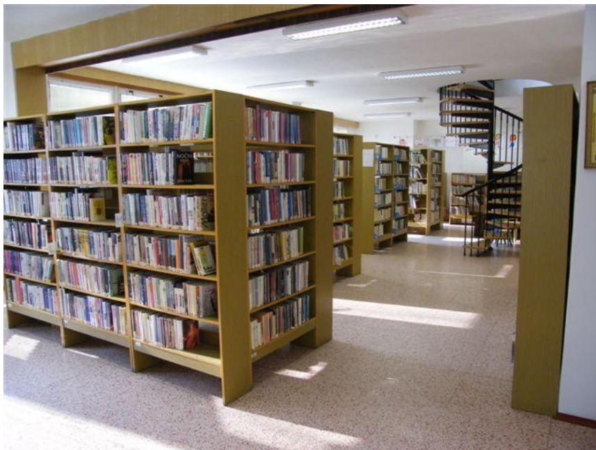
Obr. č. 3 – Studovna knihovny v Butovicích