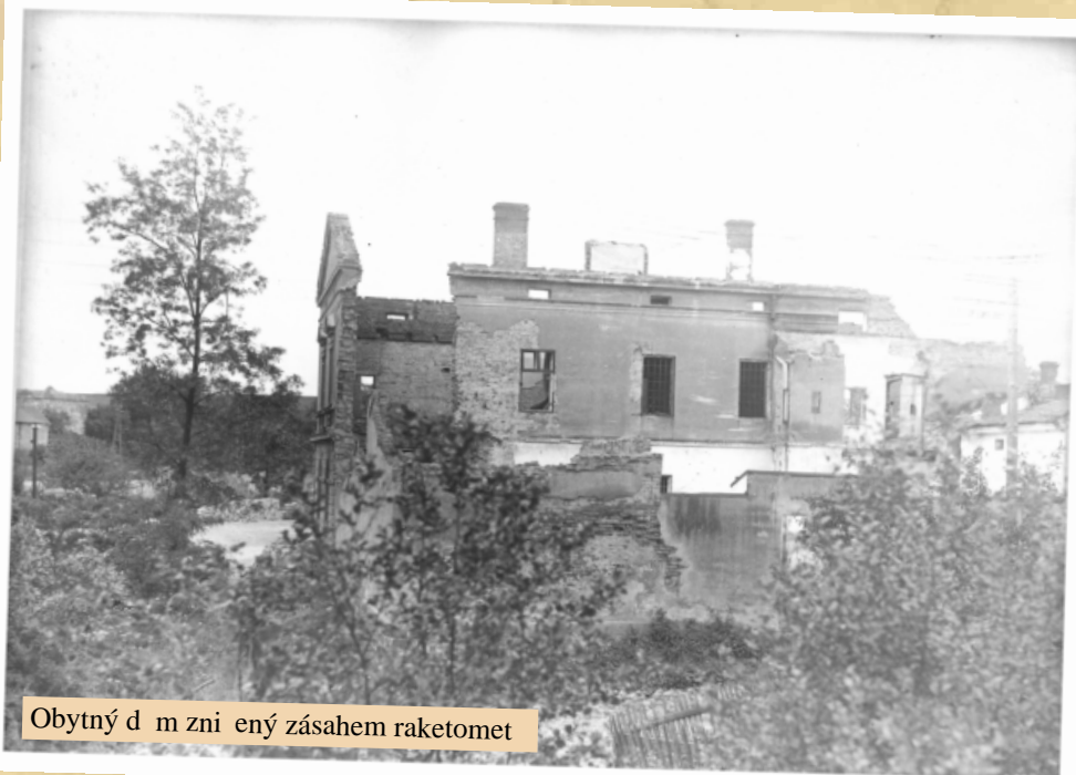
Obytný d m zni ený zásahem raketomet

a ve cvalu. Byla to pro velmi etné obecnstvo jedine ná podíváná!