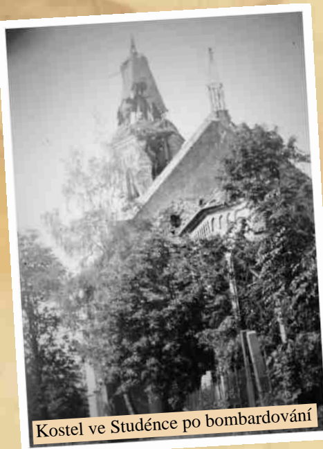
Kostel ve Studénce po bombardování