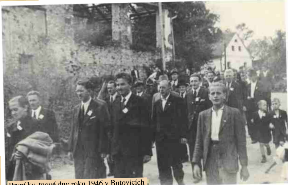
První květnové dny roku 1946 v Butovicích