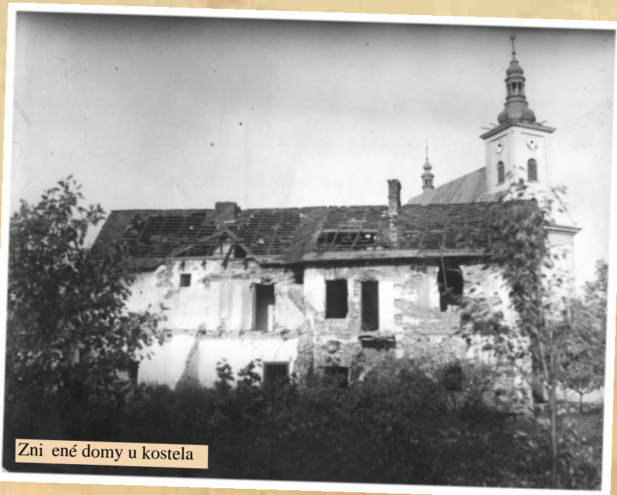
Zničené domy u kostela

Když vlak s dalším transportem zastavil před nádražím u vápenky, pokusil se jeden vzeřout, ale byl zastelen SS, který ho k dovršení zvrhlosti propíchl bajonetem.