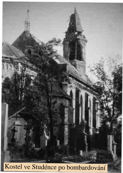
Kostel ve Studénce po bombardování