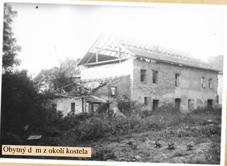
Obytný dům z okolí kostela

Dopoledne byl bombardován Koblov u Hrušova. Odpoledne se připojily k osobnímu vlaku na našem nádraží 4 vagony se soukmenovci – matky s dětmi z našeho okolí. Nastává obleva.