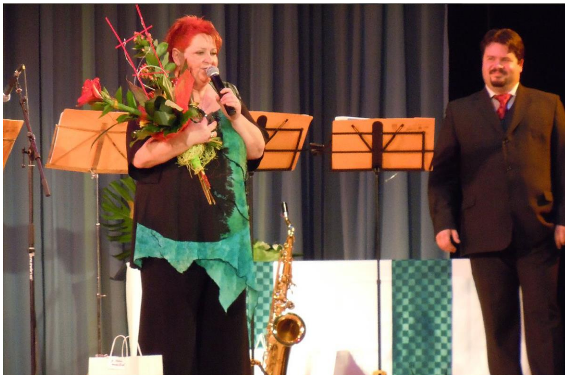
VYHLÁŠENÍ ÚSPĚŠNÝCH OBČANŮ MĚSTA STUDÉNKY