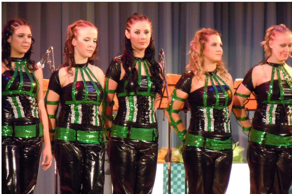
VYHLÁŠENÍ ÚSPĚŠNÝCH OBČANŮ MĚSTA STUDÉNKY