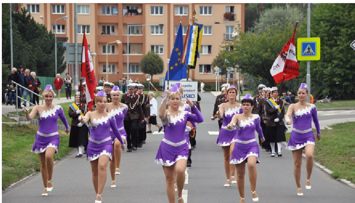
MEZINÁRODNÍ FESTIVAL DECHOVÝCH ORCHESTRŮ STUDÉNKA-JISTEBNÍK 2012