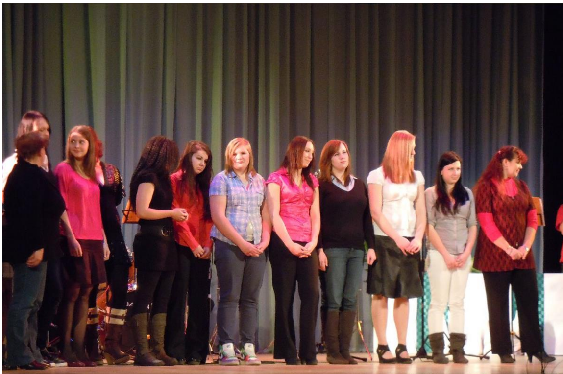
VYHLÁŠENÍ ÚSPĚŠNÝCH OBČANŮ MĚSTA STUDÉNKY