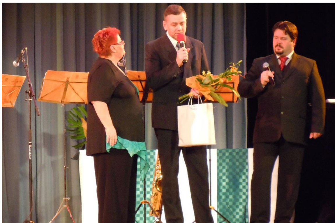
VYHLÁŠENÍ ÚSPĚŠNÝCH OBČANŮ MĚSTA STUDÉNKY