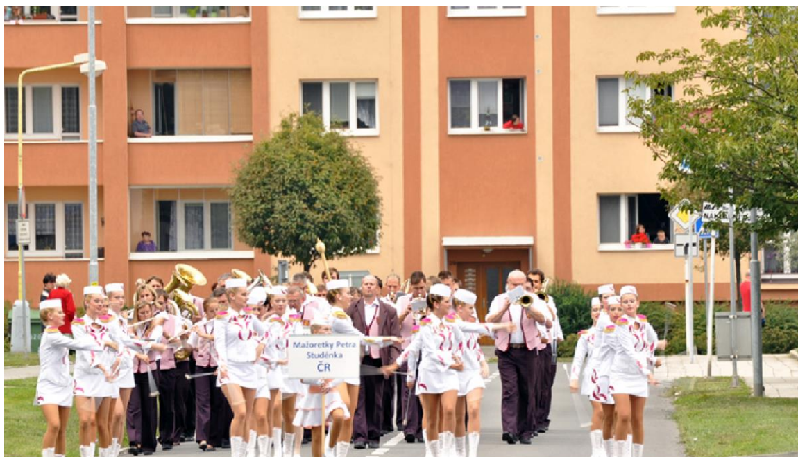
MEZINÁRODNÍ FESTIVAL DECHOVÝCH ORCHESTRŮ STUDÉNKA-JISTEBNÍK 2012