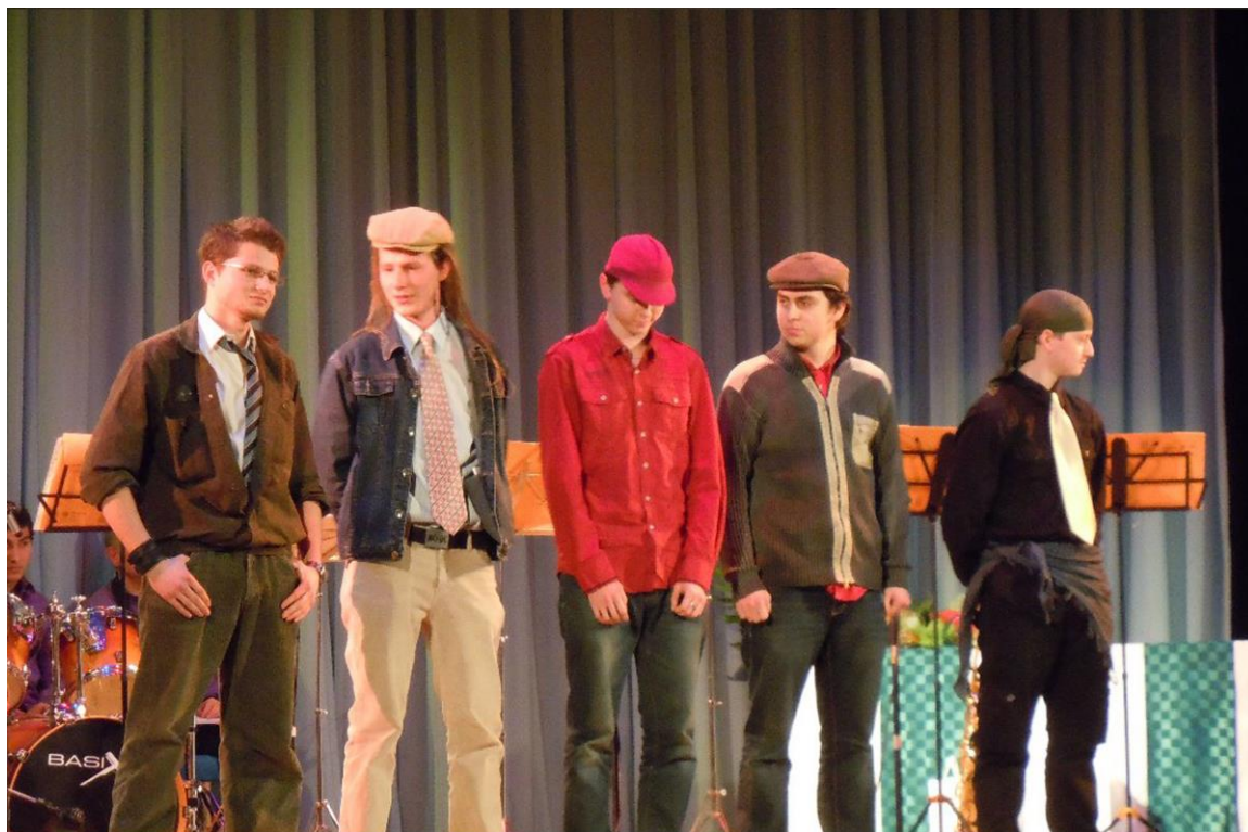
VYHLÁŠENÍ ÚSPĚŠNÝCH OBČANŮ MĚSTA STUDÉNKY