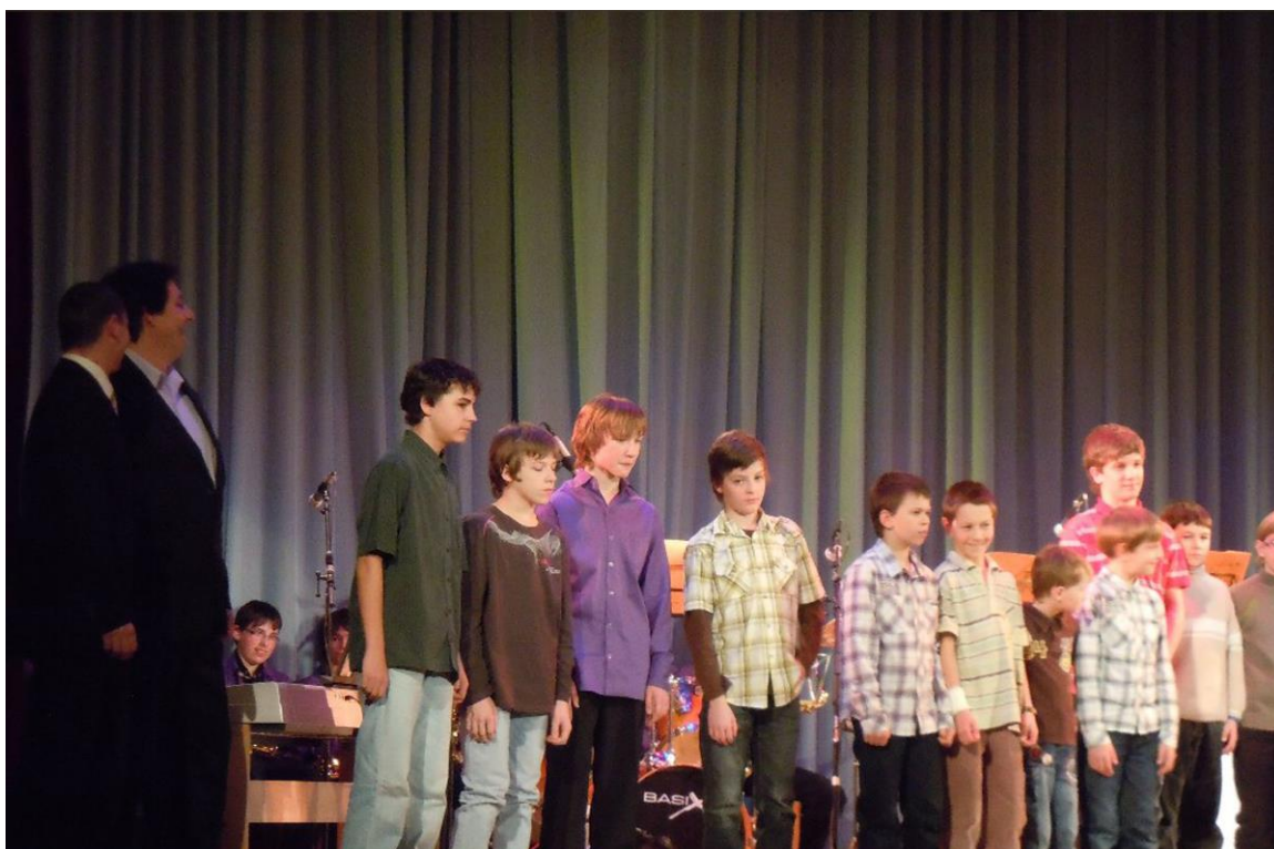
VYHLÁŠENÍ ÚSPĚŠNÝCH OBČANŮ MĚSTA STUDÉNKY