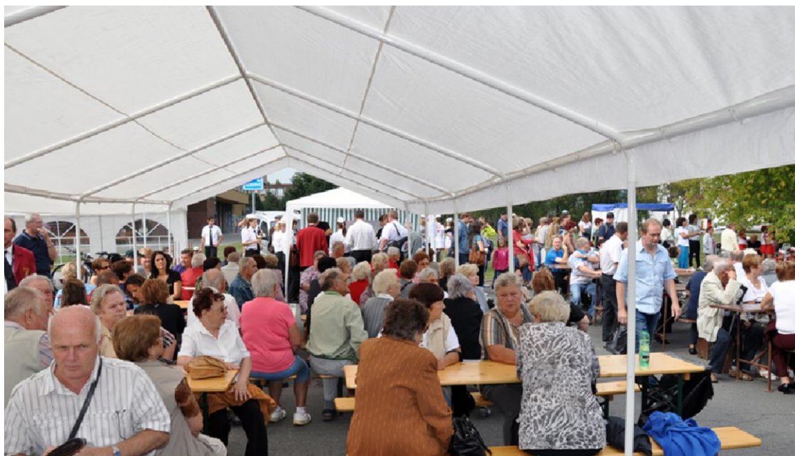
MEZINÁRODNÍ FESTIVAL DECHOVÝCH ORCHESTRŮ STUDÉNKA-JISTEBNÍK 2012