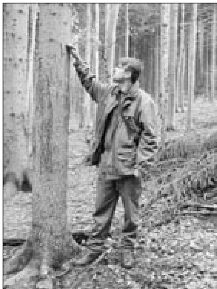
přírody (Ministerstvo životního prostředí, Agentura ochrany přírody a krajiny).

Výsledky mapování proto využívá při své odborné a rozhodovací činnosti Správa CHKO Beskydy – zároveň budou poskytnuty i ústředním pracovištím státní ochrany