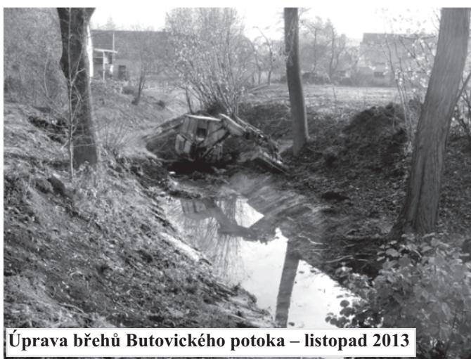
Úprava břehů Butovického potoka – listopad 2013