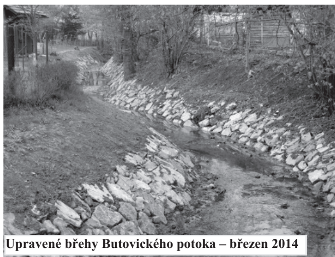
Upravené břehy Butovického potoka – březen 2014