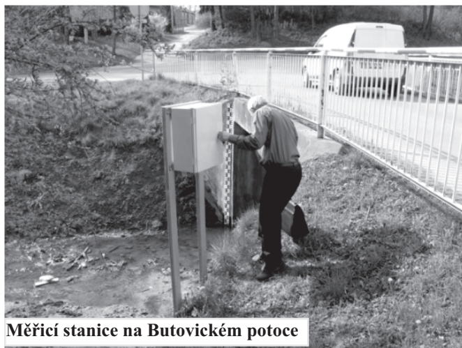
Měřicí stanice na Butovickém potoce