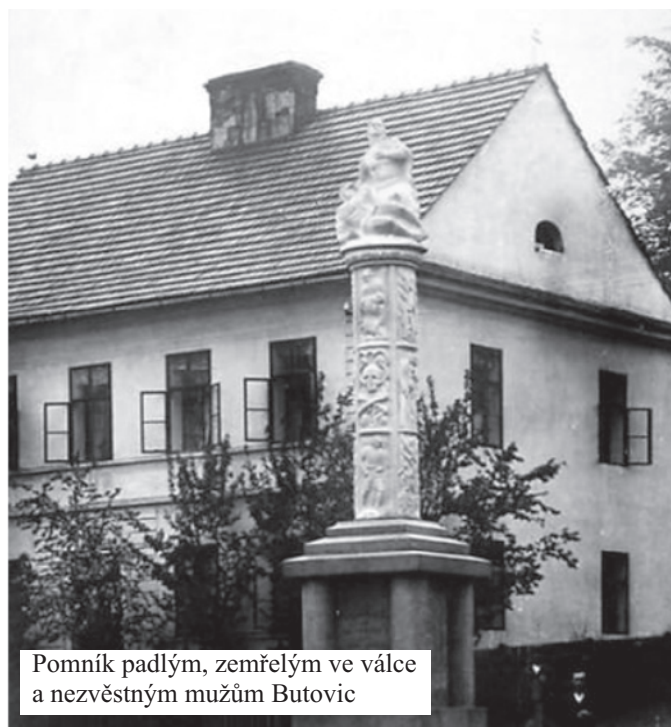
Pomník padlým, zemřelým ve válce a nezvěstným mužům Butovic

Další noví obyvatelé Butovic byli uprchlíci z Haliče. První z nich odjeli zároveň s vojskem v srpnu 1915. Další skupina přijela v září 1916 a byla ubytována v horním Meierhofu