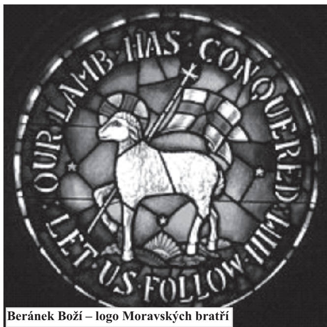
Beránek Boží – logo Moravských bratří

Emigrovala v březnu 1743 z Butovic. O dva roky později