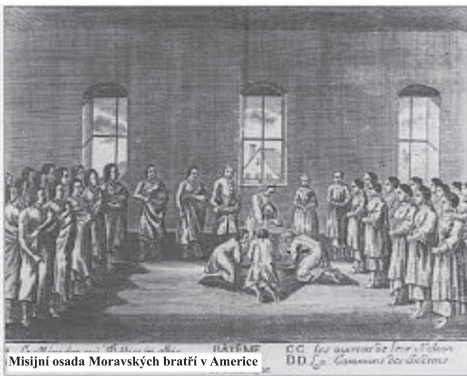
Misijní osada Moravských bratří v Americe