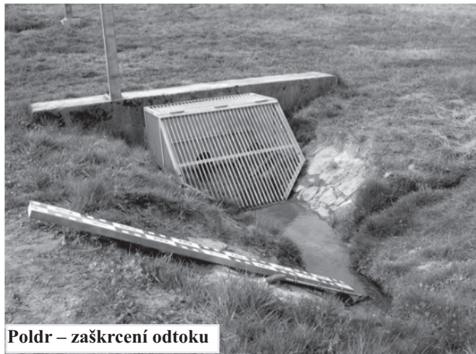
Poldr – zaškrcení odtoku