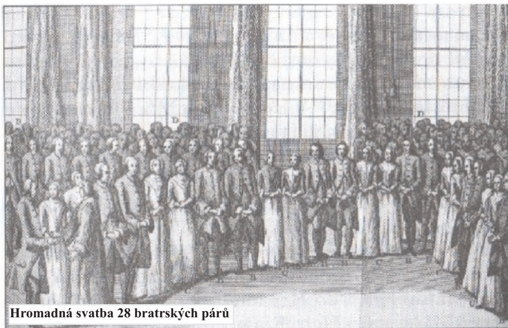
Hromadná svatba 28 bratrských párů