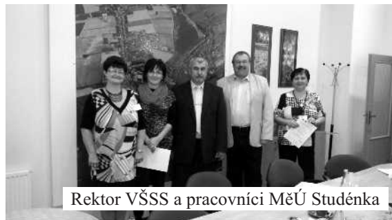
Rektor VŠSS a pracovníci MěÚ Studénka

Výstupem projektu bylo vytvoření uceleného souboru 12 vzdělávacích modulů v systému celoživotního učení pro cílovou skupinu projektu, tj. úředníky orgánů územní samosprávy a státní správy v Moravskoslezském kraji. Celkově bylo do projektu zapojeno 79 osob, přičemž úspěšně podpořeno bylo 62 úředníků z Magistrátu města Havířova, Magistrátu města Frýdku-Místku, Městského úřadu Orlová a Městského úřadu Studénka. Nejvíce preferovaným tématem byla Etika ve veřejné správě, naopak nejméně navštěvovaným seminářem bylo téma Manažerské informační systémy. Dne 2. prosince 2014 se konala na VŠSS, ICV Havířov závěrečná konference projektu, které se zúčastnilo 26 osob. Více informací k projektu můžete nalézt na webových stránkách www.incev.cz .