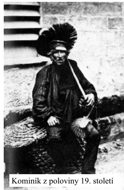
Kominík z poloviny 19. století

Kominické řemeslo patřilo v Čechách k privilegovaným. První kominický cech byl založen v roce 1626 v Třeboni a v roce 1748 „Pražský kominický cech“ s vlastní pečeti sv. Floriána. V roce 1821 byla Dekretem zemské vlády vydána ustanovení o propůjčování