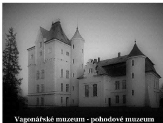
Vagonářské muzeum - pohodové muzeum