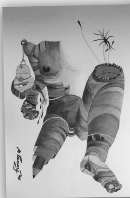
MARIE FARNÁ JSEM SLOVO