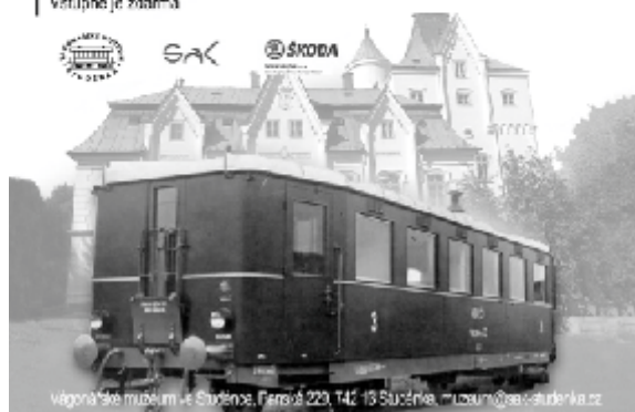
Vagonářské muzeum ve Studénce, Feniš 229, 742 13 Studénka, muzeum@sak-studenka.cz